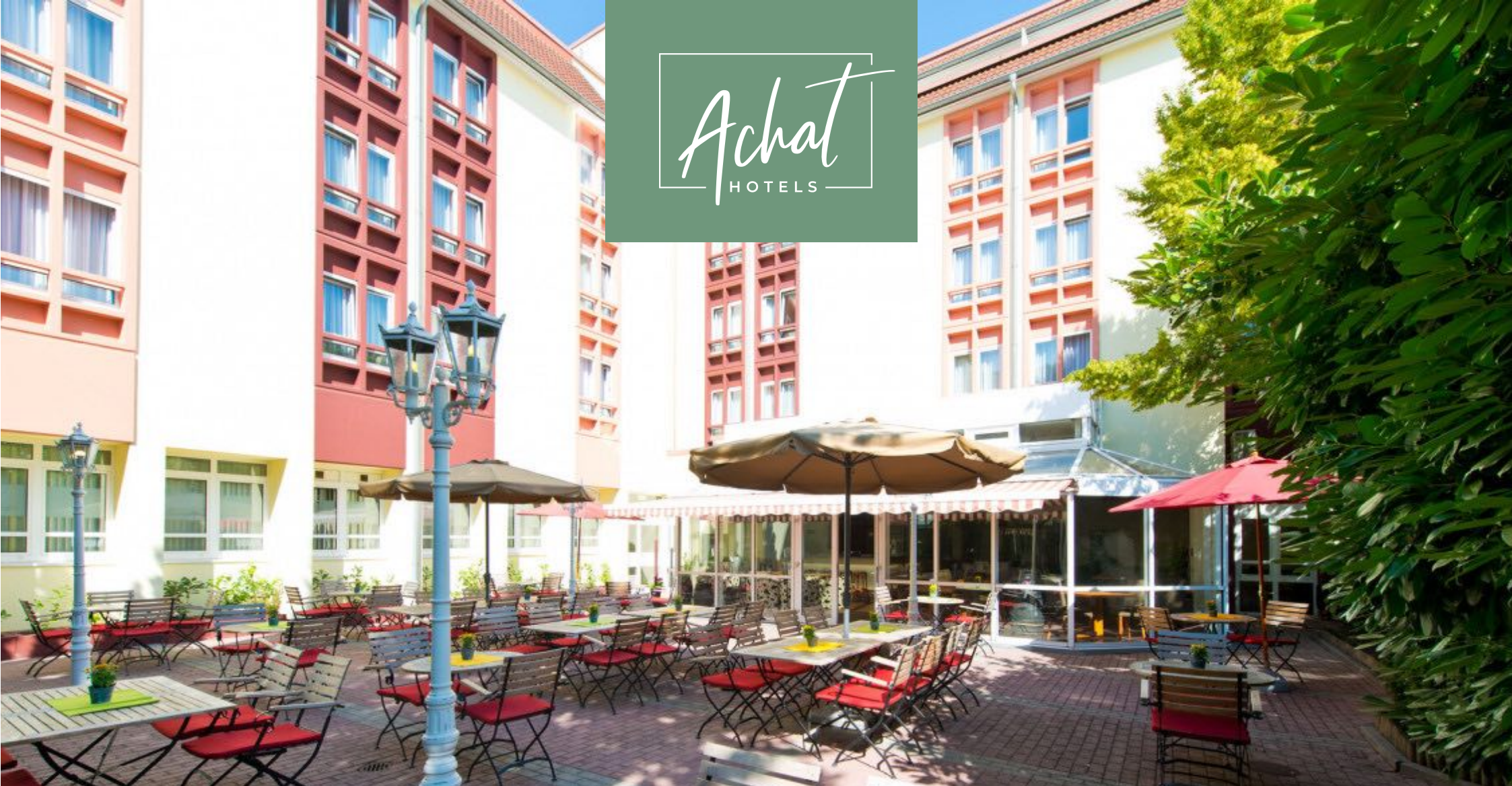
ACHAT Tagungshotel Neustadt Weinstraße