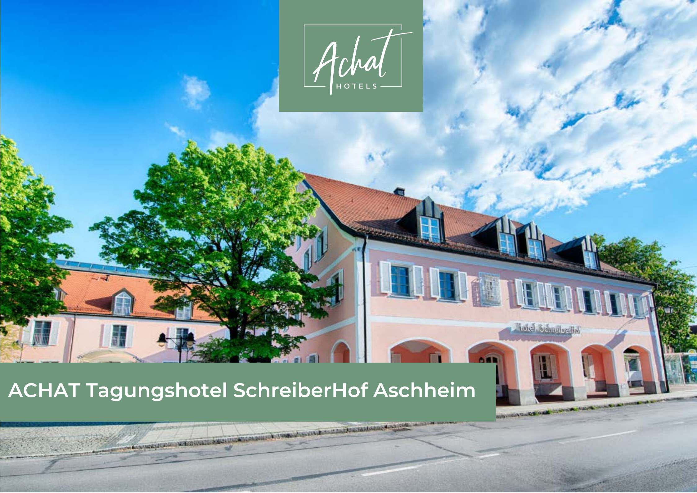
ACHAT Tagungshotel SchreiberHof Aschheim